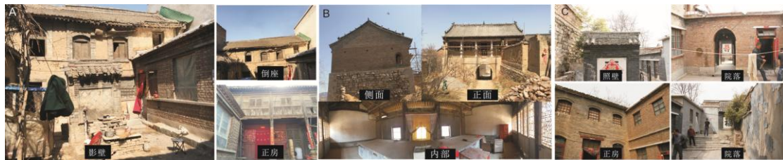
图4 “朝鲜义勇军总部旧址建筑”(A)、“一二九师轮训队旧址建筑”(B)、“一二九师三五八旅旧址建筑”(C)现状

“一二九师轮训队旧址建筑”为一座两层坡屋顶砖木结构建筑，底层有拱形洞口用于街道穿行。墙体和屋顶有损毁现象，需修缮和维护（图4B）。“八路军一二九师先遣团旧址建筑”为一进院落，砖结构建筑，正房和西厢房为两层坡屋顶建筑，倒座为一层平屋顶建筑，东厢房被住户翻盖重建。原有建筑保存相对较好，但屋顶和个别墙体有损毁和开裂现象。“太行军区司令部办公室旧址建筑”为一进院落，正房及东西厢房为一层砖结构建筑，保存相对较好，但西厢房墙体有破