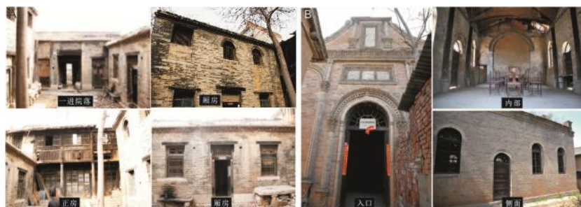
图 3 “清漳游击队旧址建筑”(A)和“太行行署礼堂旧址建筑”(B)现状

远缺乏维护, 墙体和屋顶多有损毁和残破, 急需修缮(图 3-3A)。“太行行署礼堂旧址建筑”为砖木结构建筑, 坐北朝南。由于年久失修, 部分屋顶塌漏, 墙体损毁, 急需修缮和维护(图 3-3B)。