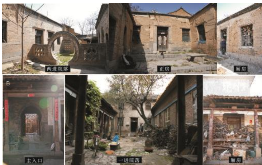
图 2 “偏城县委旧址建筑”(A)和“晋冀鲁豫边区交通总局旧址建筑”(B)现状

还保留着原来的建筑形式, 但墙体有破损剥落的现象, 需要修缮和维护。但东厢房已被住户翻盖重建(图 2B)。