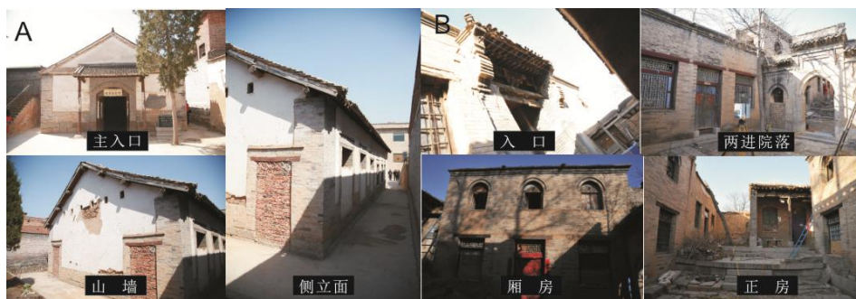
图 1 “八路军一二九师政治部礼堂旧址建筑”（A）和“偏城县武委会旧址建筑”（B）现状

破损和墙皮剥落的现象，需要修缮和维护（图 1A）。武委会旧址建筑为两进院落，坐北朝南，前院为武委会，东西厢房各 3 间，倒座为 5 间，中间为大门。由于缺乏管理和维护，个别墙体有破损和剥落现象，需对旧址建筑进行妥善的修缮和维护（图 1B）。