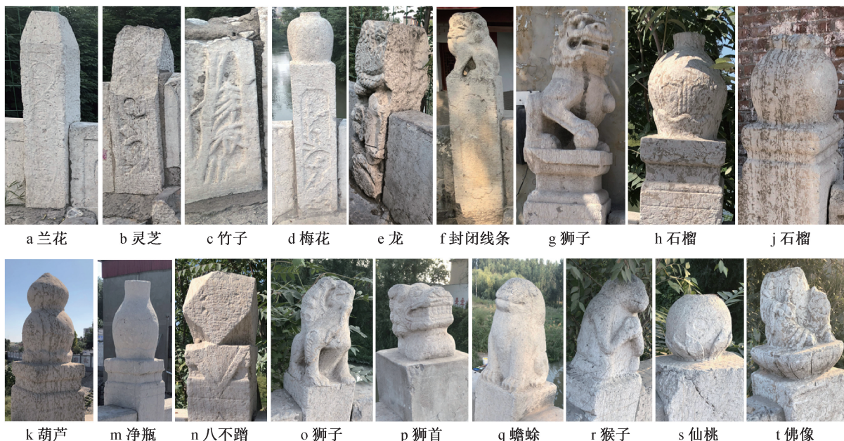
图3 石拱桥望柱柱身和柱头样式

柱头雕刻采用圆雕雕刻的手法,雕刻出立体生动的形象立于柱头,各地方柱头样式具有地方特色,种类样式丰富,大多是表达对风调雨顺、美满幸福的追求。柱头装饰可分为动物类、植物类、器物类、人物类等。如南关石桥(图3-g、h、j、k、l、n)与石桥村石桥(图3-o、p、q、r、s、t)的柱头的雕刻样式中,动物类包括狮子、蟾蜍、猴子等,植物类包括石榴、葫芦、仙桃等,器物类则有净瓶等,人物类以佛像为主,还有象征宗教文化的八不蹭等。