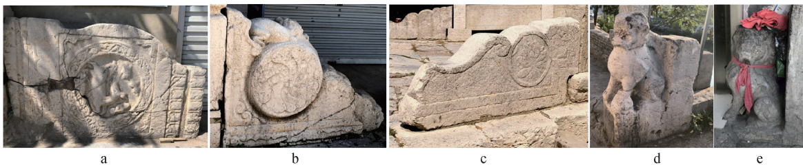
图4 石拱桥的抱鼓石与靠山兽

于桥北端的抱鼓石(图4-a)为仙鹿踏着祥云的纹样,象征着福禄双全、风调雨顺的美好愿望。南关石桥位于桥南端的抱鼓石(图4-b)为旋水纹,亦称为月华纹,这个图案来源于佛教中的“卍”字,象征着生命的无限延续,用于桥梁中,表达着对长命百岁的向往、健康平安的美好期盼 [6] 。弘济桥的抱鼓石(图4-c)采用了莲花的装饰纹样,象征着对美好品德的号召。北苏曹桥采用了狮子靠山兽(图4-d)的装饰样式,通过圆雕的立体狮子形象立于桥端,来保护桥体的安全稳固,寄托了人们对于出入平安的美好期盼。