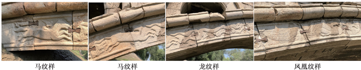
图5 弘济桥券脸石凤凰纹样

装饰拱券的作用。如弘济桥主拱券的券脸石装饰纹样,以龙门石处的戏水兽为中心,左右两侧对称进行雕刻,对称的部分纹样相同。其纹样组成序列为马、龙、凤凰、戏水兽等(图5),采用的均为动物类纹样。各种祥瑞象征的动物纹样穿梭于祥云之上,象征着人们对幸福生活的美好憧憬。